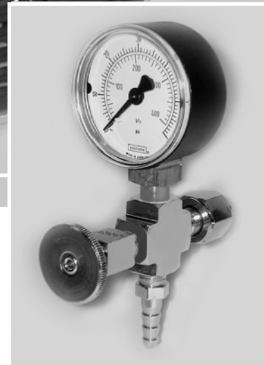
Nro. 184 Manómetro, Válvula y Lengüeta de salida

El modelo MadaMist 50 esta diseñado para utilizarse con humidificadores, nebulizadores, y cámaras de oxígeno.