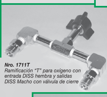
Nro. 1711T Ramificación "T" para oxígeno con entrada DISS hembra y salidas DISS Macho con válvula de cierre