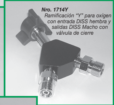
Nro. 1714Y Ramificación "Y" para oxígeno con entrada DISS hembra y salidas DISS Macho con válvula de cierre