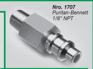
Nro. 1707 Puritan-Bennett 1/8" NPT