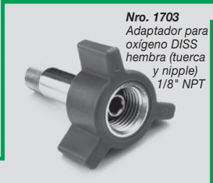
Nro. 1703 Adaptador para oxígeno DISS hembra (tuerca y nipple) 1/8" NPT