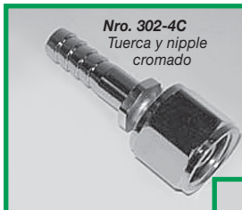
Nro. 302-4C Tuerca y nipple cromado

Mada provee una línea completa de adaptadores de entrada para los mas populares flujómetros para oxígeno y aire médico. Instalado en su flujómetro por el fabricante.