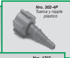
Nro. 302-4P Tuerca y nipple plastico