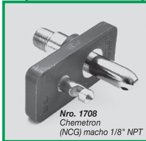
Nro. 1708 Chemetron (NCG) macho 1/8" NPT