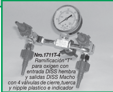
Nro. 1711T-4 Ramificación "T" para oxígeno con entrada DISS hembra y salidas DISS Macho con 4 válvulas de cierre, tuerca y nipple plastico e indicador

Nota: Los adaptadores arriba indicados están también disponibles para aire.