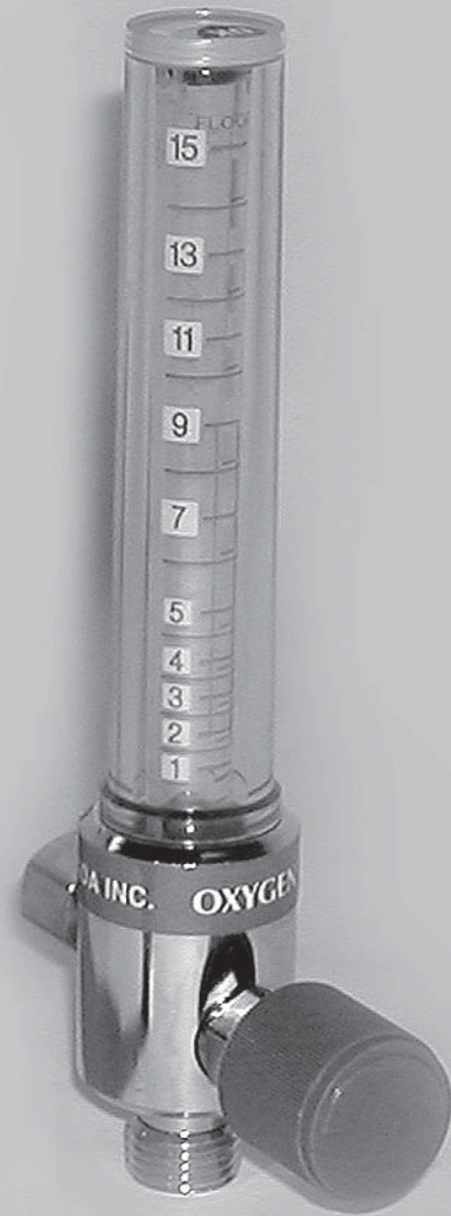
Nro. 1701 SERIE