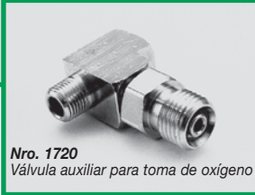
Nro. 1720 Válvula auxiliar para toma de oxígeno